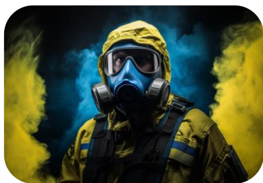
ЗАСОБИ ЗАХИСТУ ВІД РАДІАЦІЇ ДЛЯ ДЕРЖАВНОЇ СЛУЖБИ З НАДЗВИЧАЙНИХ СИТУАЦІЙ УКРАЇНИ (ДСНС)