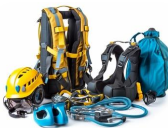
ОБЛАДНАННЯ ДЛЯ РОЗБИРАННЯ ЗАВАЛІВ ТА ПОРЯТКУНКУ ЛЮДЕЙ ПІСЛЯ РАКЕТНИХ АТАК ДЛЯ ДЕРЖАВНОЇ СЛУЖБИ З НАДЗВИЧАЙНИХ СИТУАЦІЙ УКРАЇНИ (ДСНС)