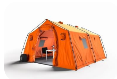
90 МОБІЛЬНИХ ГОСПІТАЛЕЙ ДЛЯ ДЕРЖАВНОЇ СЛУЖБИ З НАДЗВИЧАЙНИХ СИТУАЦІЙ УКРАЇНИ (ДСНС)