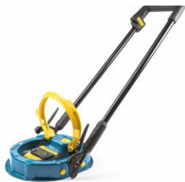
ОБЛАДНАННЯ ДЛЯ РОЗМІНУВАННЯ ДЛЯ ДЕРЖАВНОЇ СЛУЖБИ З НАДЗВИЧАЙНИХ СИТУАЦІЙ УКРАЇНИ (ДСНС)