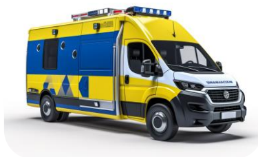
11 КАРЕТ ШВИДКОЇ ДОПОМОГИ ДЛЯ ДЕРЖАВНОЇ СЛУЖБИ З НАДЗВИЧАЙНИХ СИТУАЦІЙ УКРАЇНИ (ДСНС)