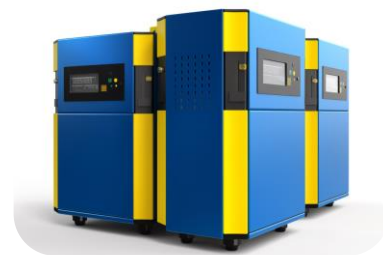
5 БЕЗШУМНИХ ГЕНЕРАТОРІВ ДЛЯ МОБІЛЬНИХ ШПИТАЛІВ ТА ДЛЯ НАДЗВИЧАЙНИХ СИТУАЦІЙ ДЛЯ ДЕРЖАВНОЇ СЛУЖБИ З НАДЗВИЧАЙНИХ СИТУАЦІЙ УКРАЇНИ